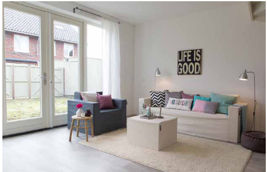
Kartonnen meubels, voorzien van een stoffen hoes of fotoprint, toveren een leeg huis om tot een sfeervol onderkomen.